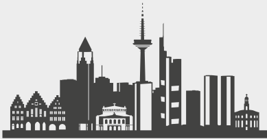
Abbildung 2 Zahlen zur Jugendarmut in Frankfurt / Main

In Frankfurt am Main leben 741.093 Personen . 1 Davon sind 16,7 Prozent bzw. 123.762 Personen unter 18 Jahre .